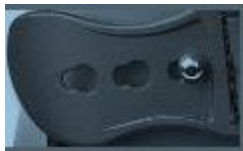
Pinsluitingen: Sluitingen met een flap welke over een uitstekende pin past.

Bij achterbeen bescherming zijn alleen de volgende 2 type sluitingen zijn toegestaan: